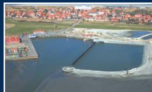
Seebrücke im Hafen Juist Gemeinde Juist