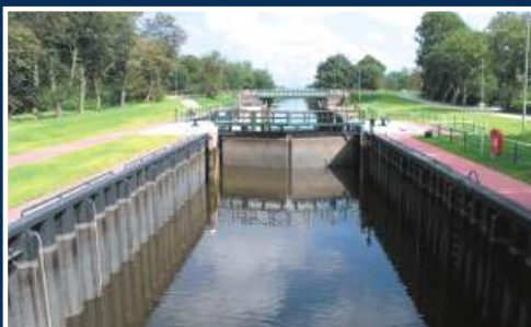
Umbau Schleuse Borssum in Emden Niedersächsischer Landesbetrieb für Wasserwirtschaft, Küsten- und Naturschutz (NLWKN), Aurich