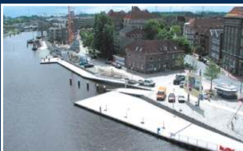
Ausbau Binnenhafen Emden Stadt Emden