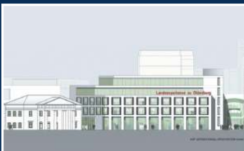
LzO-Filiale Schloßplatz, Oldenburg LzO Oldenburg Entwurf: KSP Jürgen Engel Architekten GmbH, Braunschweig