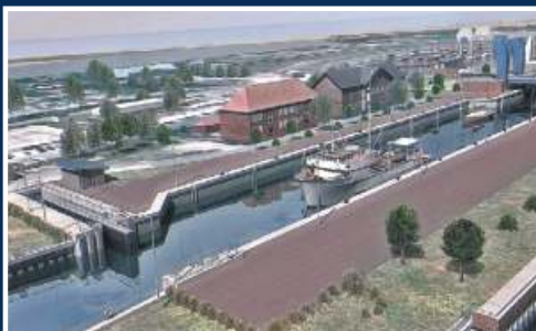
Schleuse Nesserland im Hafen Emden Niedersachsen Ports, Emden