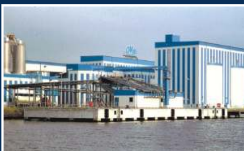
Pierplatte im Ölhafen Emden Niedersachsen Ports, Emden