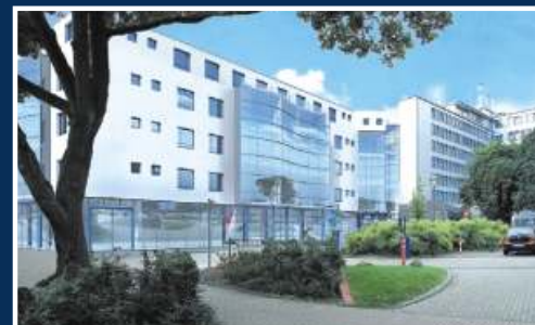
Ärztehaus mit Strahlentherapie DIAKO, Ev. Diakonie Krankenhaus, Bremen. Entwurf: Architekturbüro Buss-Weber, Remels