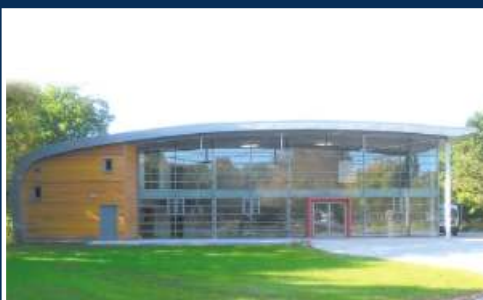
Musikforum an der IGS Flöteenteich Stadt Oldenburg, Eigenbetrieb Gebäudewirtschaft und Hochbau