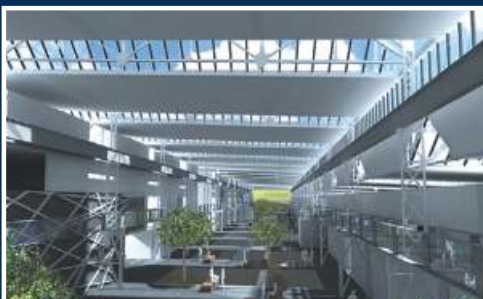
Institutsgebäude der FH Osnabrück im ehemaligen Eisenbahnausbesserungswerk, Lingen. FH Osnabrück / Stadt Lingen. Entwurf: PLAN | CONCEPT ARCHITEKTEN, Osnabrück