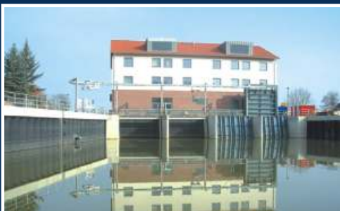
Hochwasserschutz für Hitzacker und die Jeetzelniederung Jeetzeldeichverband / NLWKN Lüneburg