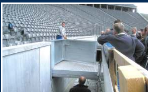
Bewegliche Notbrücken im Olympiastadion Berlin Senat der Stadt Berlin. Entwurf: gmp Architekten von Gerkan, Marg und Partner, Berlin