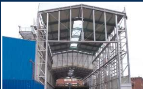
Zentralwerkstatt der Schiffswerft Thyssen Nordseewerke Emden